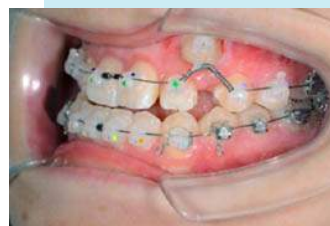
(図4) 全体の歯にブラケットを付けて仕上げをする(18歳6ヶ月)