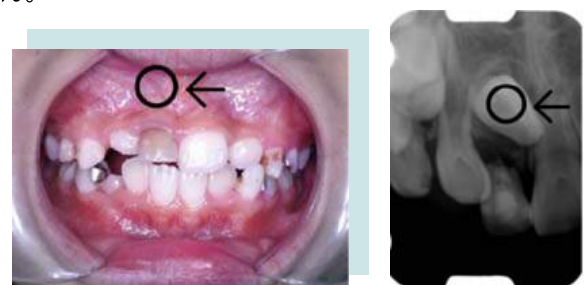
（図1）右上前歯の埋伏とレントゲン写真

などにより矯正装置で誘導する方法や期間が決まります。歯列内に誘導しても歯根が湾曲しているため、歯として使えない場合もあります。まれに埋伏している歯が、まわりの骨と癒着している場合は引き出せません。