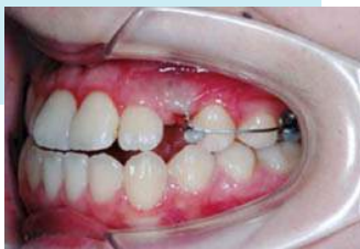
(図3) 埋伏している犬歯に部品を付けて引き出す