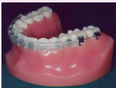
シリコン製のブラケットカバー

痛みが出ると不安になりますが、通常数日でなくなります。あなたの歯並びやかみ合わせがきれいになるように、しばらく我慢して頑張ってください。